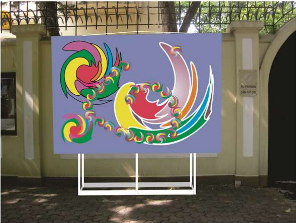
PHỐI CẢNH KHUNG TRANH TREO TRÊN KHUNG NHÔM LẬP GIÁP