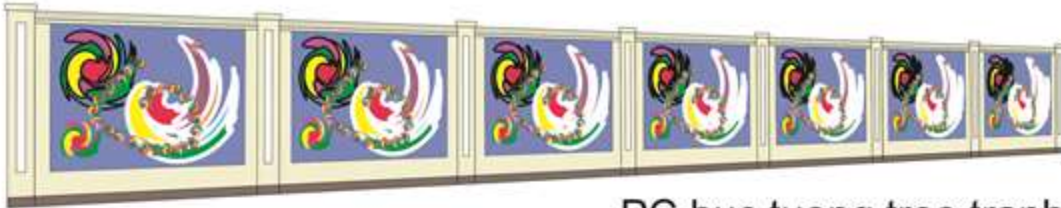
PC bức tuong treo tranh