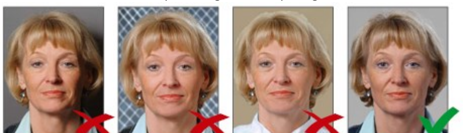
Đổ bóng phía sau