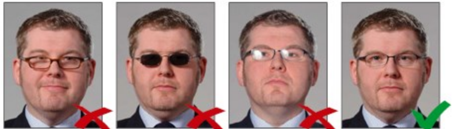
Gọng kính che mắt

Gọng kính không được phép che khuất mắt. ◀