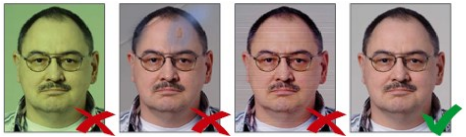
Bị nhuộm màu

Có thể nộp ảnh màu hoặc ảnh trắng đen. ◀