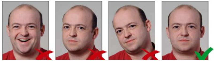
Miệng mở quá to

Người chụp cần có biểu cảm trung tính, miệng khép và nhìn thẳng vào máy ảnh. ◀